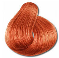
7.43 Loiro Médio Cobre Dourado