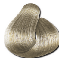
10.1 Loiro Clarissimo Acinzentado