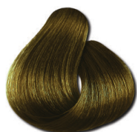
7.31 Loiro Médio Bege