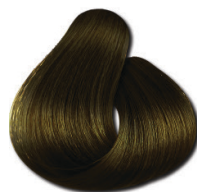
7.13 Loiro Médio Mate