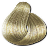
9.0 Loiro Muito Claro