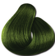
0.13 Mate Intenso