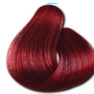
7.66 Loiro Médio Vermelho Especial Intenso