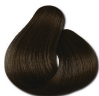
6.1 Loiro Escuro Acinzentado