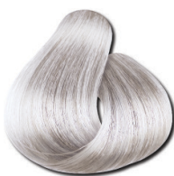
11.21 Loiro Ultra Claro Irisado Acinzentado