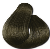
7.1 Loiro Médio Acinzentado