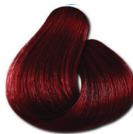
6.66 Loiro Escuro Vermelho Especial Intenso