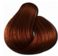
6.34 Loiro Escuro Cobre Dourado