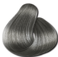
0.11 Cinza Intenso