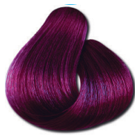
8.26 Marsala Intenso