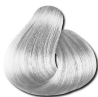
12.11 Blond Especial Cinza Intenso