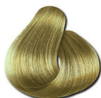
9.31 Loiro Muito Claro Bege