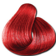
0.66 Vermelho Intenso