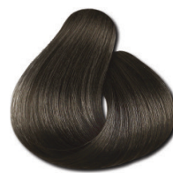
5.0 Castanho Claro