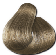
8.1 Loiro Muito Claro Acinzentado