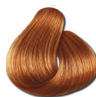
0.43 Cobre Dourado