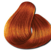
8.44 Loiro Claro Cobre Intenso