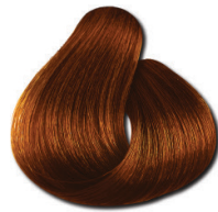
7.4 Loiro Médio Acobreado