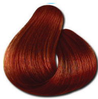
77.46 Loiro Médio Cobre Vermelho Especial