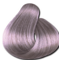
10.89 Loiro Claríssimo Pérola Especial