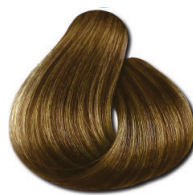
7.73 Morena Iluminada Doce de Leite