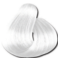
00S Super Reforçador de Clareamento