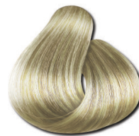
10.0 Loiro Clarissimo