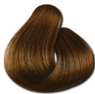
5.7 Castaanho Claro Marrom