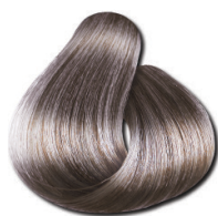
9.21 Loiro Muito Claro Irisado Acinzentado