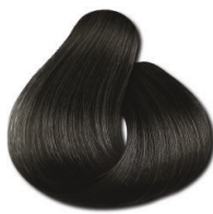
4.0 Castanho Médio