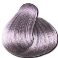
9.89 Loiro Muito Claro Pérola Especial