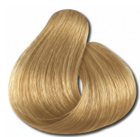
9.3 Loiro Muito Claro Dourado